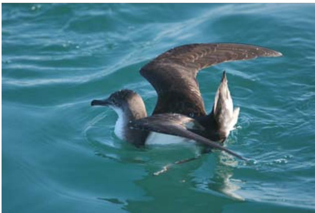
Berta minore Puffinus yelkouan . Versilia, aprile 2007 (Nunzio Carpentiero)