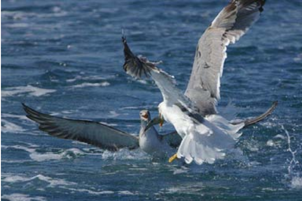
Berta maggiore Calonectris diomedea . Versilia, aprile 2007

Sabato 4 e domenica 5 luglio 2009 sono stati coperti 24 siti in cinque regioni da parte di 46 rilevatori. Sono state censite 17 specie marine e/o costiere e altre 17 specie non marine ritenute interessanti. Il numero di specie marine rilevate è notevole per il periodo, considerando che nei due precedenti monitoraggi sono state rilevate 24 specie in marzo e 29 specie in maggio. Sono state contattate specie appartenenti a tutte le categorie fenologiche tipiche del periodo: migratori post-riproduttivi precoci, estivanti, nidificanti in erratismo e/o spostamento a scopo alimentare.