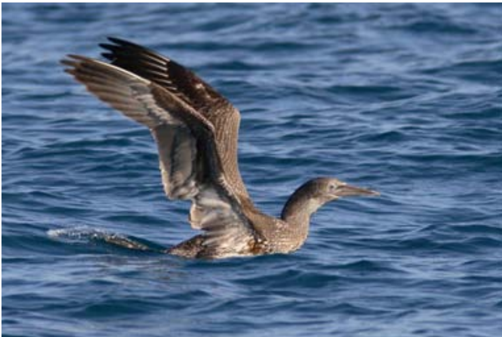
Sula Morus bassanus giovane. Versilia, ottobre 2009 (Alessio Quaglierini)