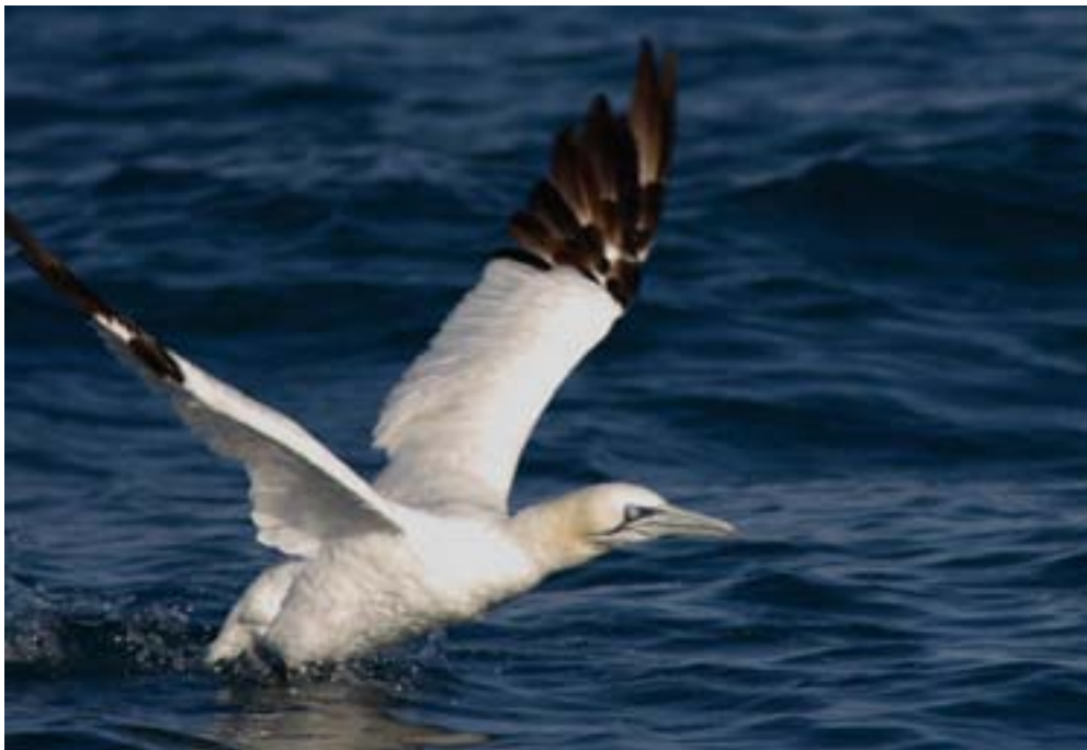
Sula Morus bassanus adulto. Versilia, ottobre 2009 (Alessio Quaglierini)

Il 5 settembre 2009 alle ore 13:00, dalla spiaggia del Lido Cea (NU) situato a pochi km a sud di Barisardo, ho osservato un gruppo compatto di 28 Sule Morus bassanus , apparentemente tutti individui adulti e subadulti.