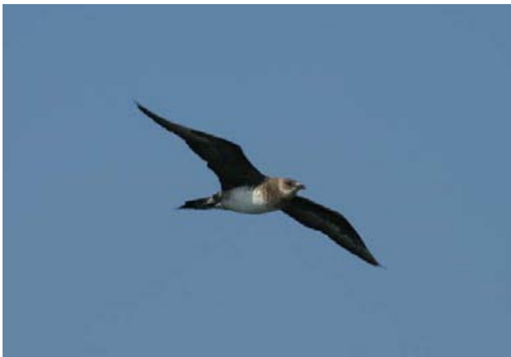
Labbo Stercorarius parasiticus . Foce del Volturno, Caserta, febbraio 2008 (Davide De Rosa)