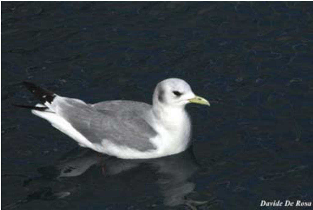
Gabbiano tridattilo Rissa tridactyla . Sapri, Salerno, febbraio 2009 (Davide De Rosa)