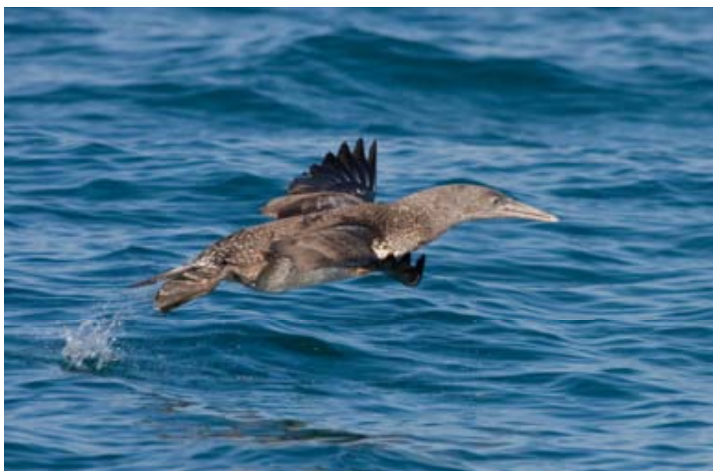
Sula Morus bassanus giovane. Versilia, ottobre 2009