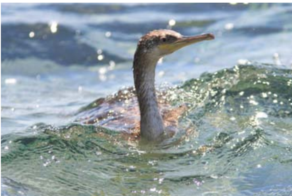
Marangone dal ciuffo Phalacrocorax aristotelis . Isola d'Elba, giugno 2009 (Alessio Quaglierini)

Sabato 7 e domenica 8 novembre 2009 sono stati coperti 44 siti in 11 regioni da parte di 74 rilevatori. Sono state censite 28 specie marine e/o costiere e altre 21 specie ritenute di un certo interesse. Il maltempo - specialmente la domenica - ha pesantemente influito sui risultati, invalidando i censimenti in più di una regione. Si è comunque rilevato un certo ritardo nella migrazione post-riproduttiva degli uccelli marini, "impressione" confermata alcuni giorni dopo il monitoraggio con i dati raccolti lungo le coste liguri e toscane. Alcune specie, anche rare (es. Gabbiano tridattilo), sono state contattate in numeri discreti per il periodo; altre (es. Stercoraridi) sono risultate quasi assenti e nettamente al di sotto dei numeri previsti, confermando una "anomalia" della migrazione post-riproduttiva, osservata anche su specie non marine.